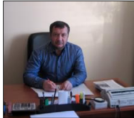
къайдайрал къевелай амал авуна кланзава.